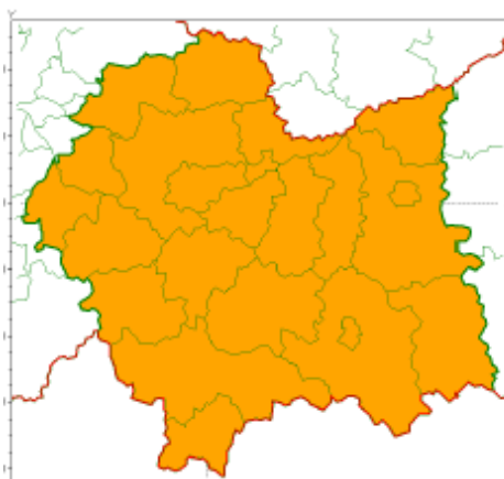
Burze z gradem 2019-08-27 07:05